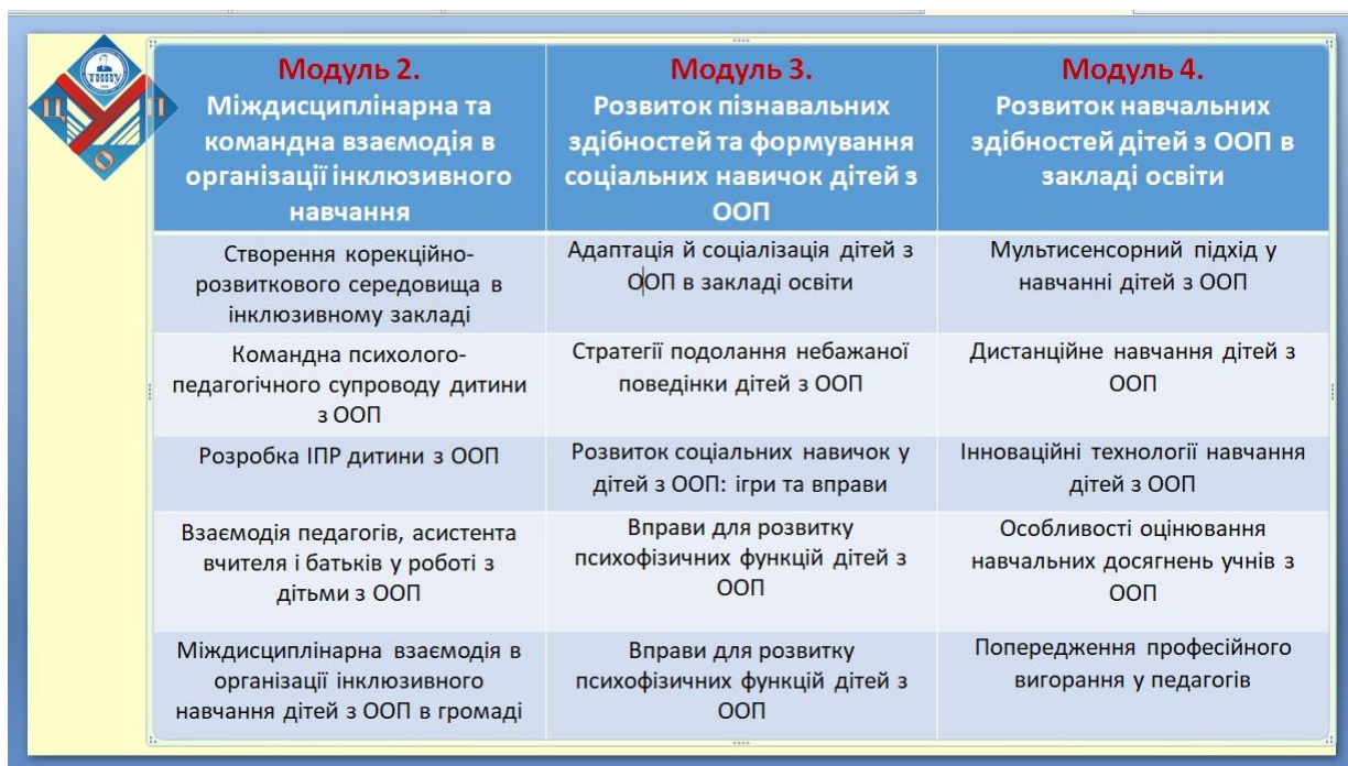
Рис. 1. Перелік освітніх програм для формування інклюзивної компетентності

Розробляючи зміст освітньої програми було взято до уваги особливості професійної діяльності педагогів в умовах інклюзивного освітнього середовища. З методичної точки зору, було враховано Концепцією реалізації державної політики у сфері реформування загальної середньої освіти «Нова українська школа», а також вимоги до компетентностей педагогічних та науково-педагогічних працівників. Основний акцент зроблено на практичному спрямуванні післядипломної підготовки педагогів. Такий практико-орієнтований підхід забезпечив педагогам реальну можливість опанування теоретичними, методичними та практичними аспектами організації інклюзивного освітнього простору в освітній установі.