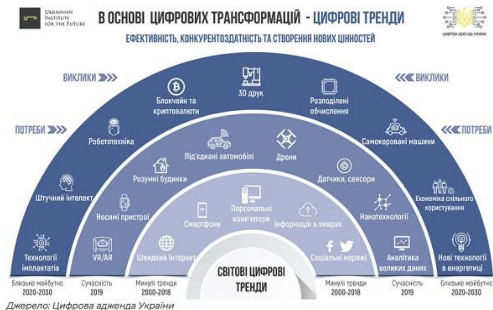
Рис. 1. Глобальні цифрові тренди до 2030 року

технологій. Їхній аналіз дає змогу прогнозувати розвиток конкретного економічного, технологічного й навіть соціального явищ у майбутньому [3, с. 12]. На рис. 1 подано цифрові тренди до 2030 року (на основі даних Українського інституту майбутнього та Цифрової адженди України 2020).